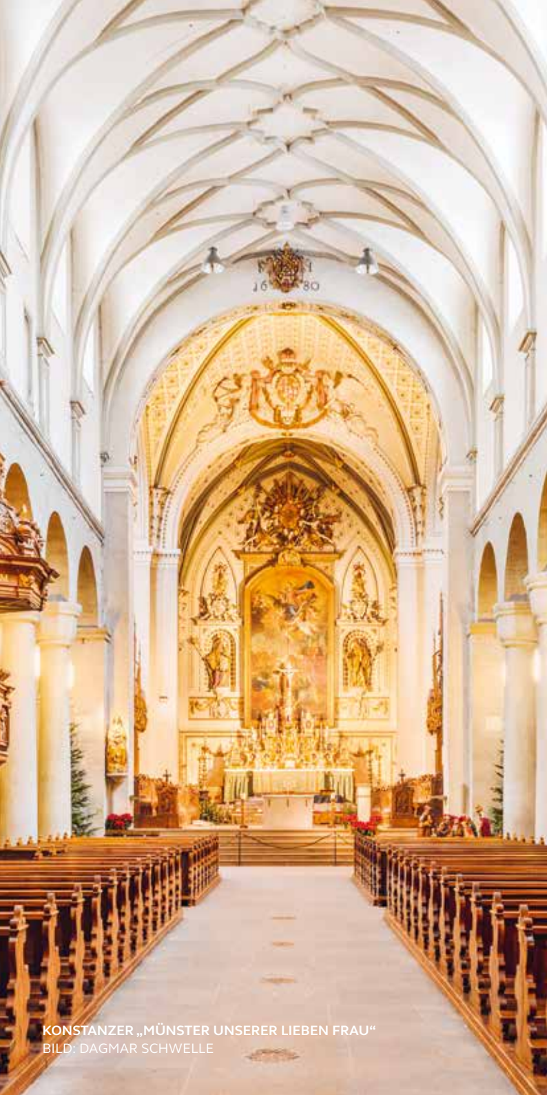
KONSTANZER „MÜNSTER UNSERER LIEBEN FRAU“