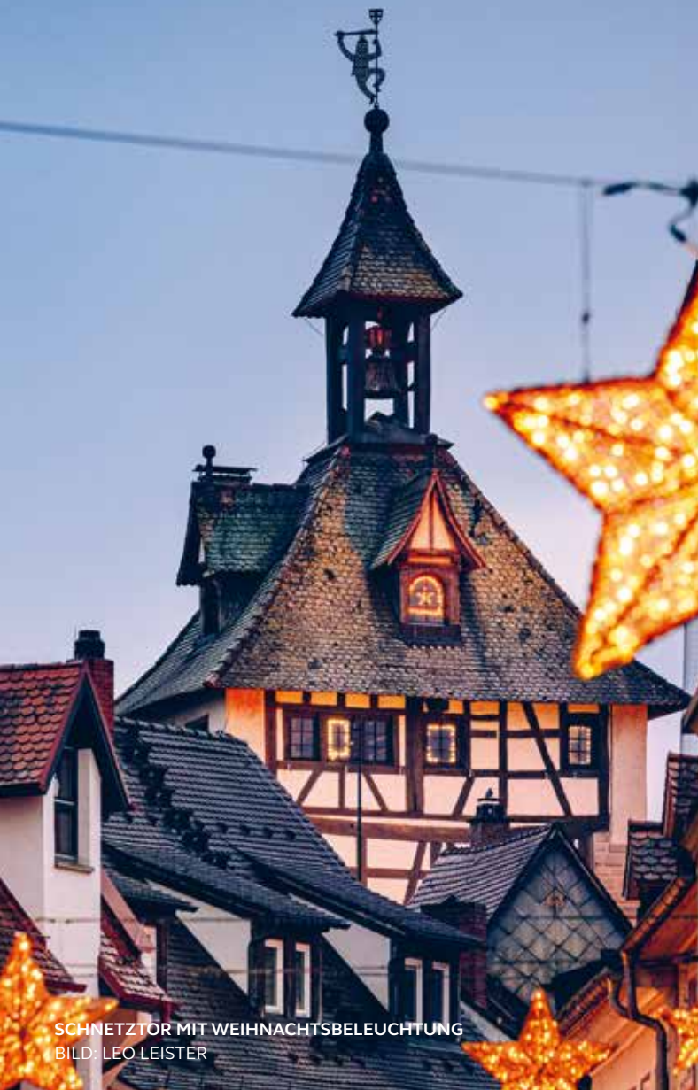
SCHNETZTOR MIT WEIHNACHTSBELEUCHTUNG