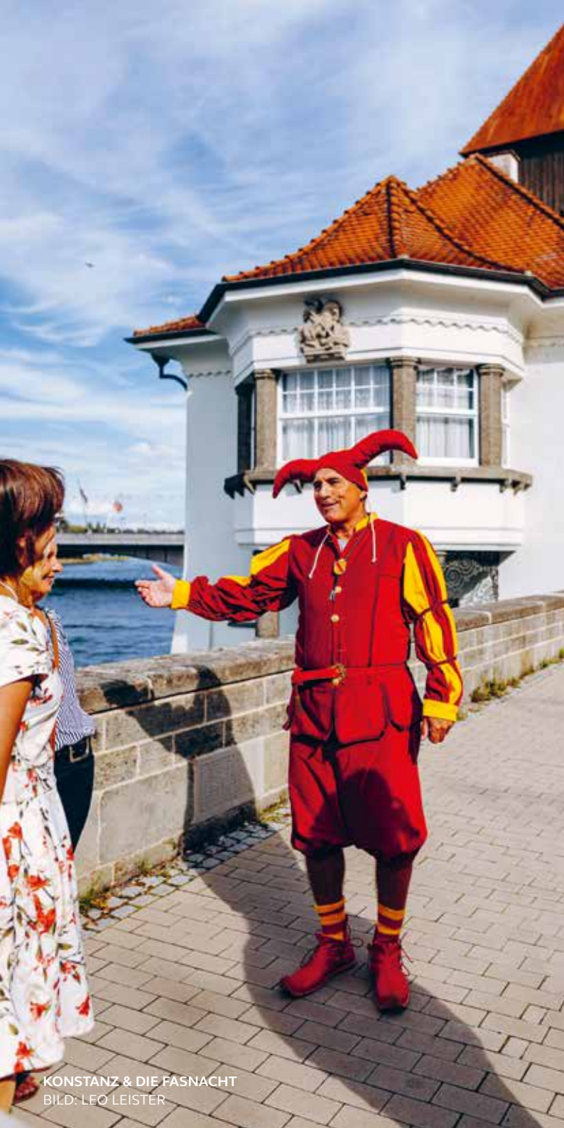
KONSTANZ & DIE FASNACHT