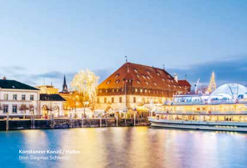
Konstanzer Konzil / Hafen