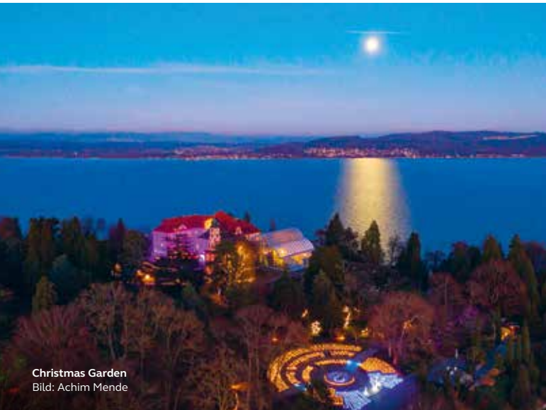
Christmas Garden

KONSTANZ-INFO.COM/EVENT/ CHRISTMAS-GARDEN-INSEL-MAINAU-10D3453F00